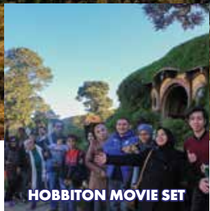
HOBBITON MOVIE SET